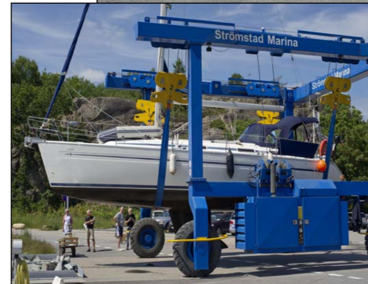
Vägövergång med rigg