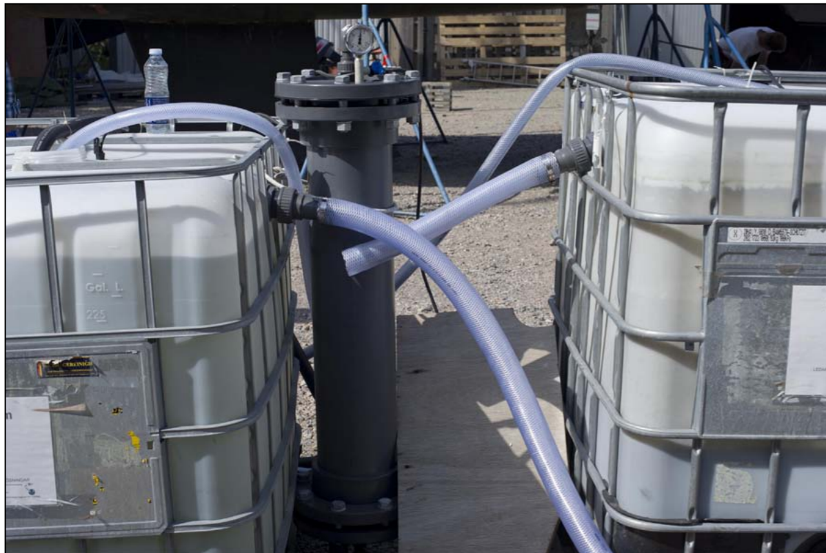
Polersteg med kolfilter och tank