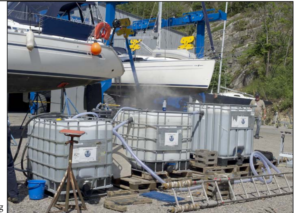
En-kammarbrunnar och polersteg