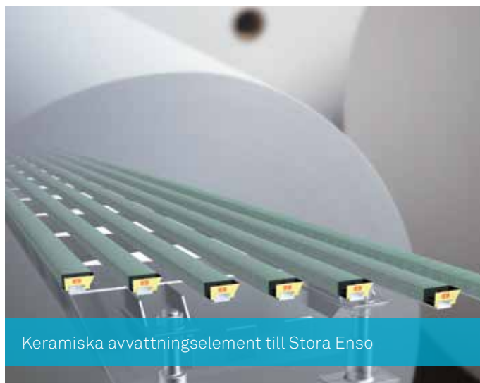
Keramiska avvattningselement till Stora Enso