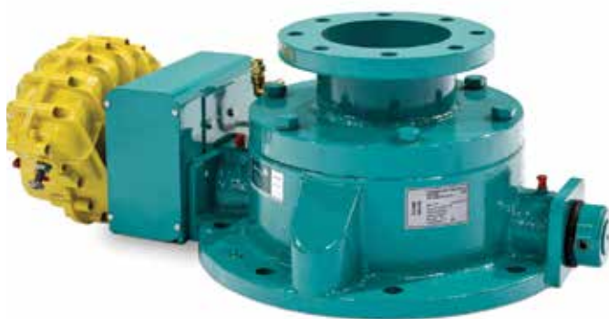
Domventil till biogasanläggning