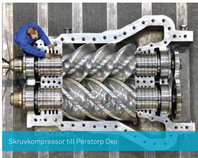
Skruvkompressor till Perstorp Oxo