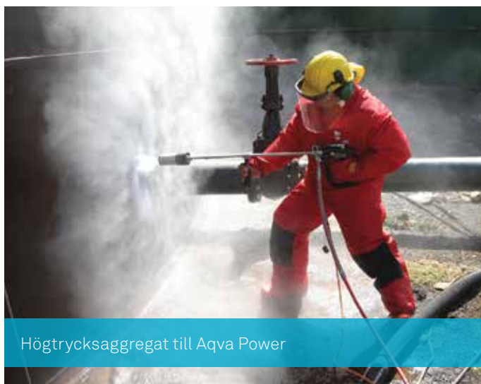
Högtrycksaggregat till Aqva Power