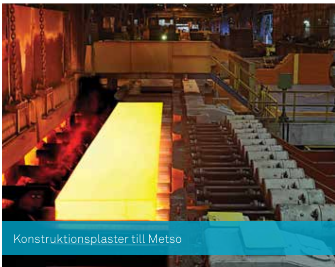
Konstruktionsplaster till Metso