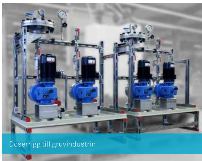
Doserrigg till gruvindustrin