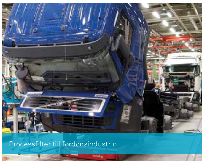
Processfilter till fordonsindustrin