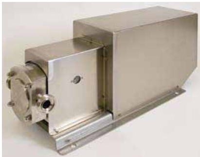
Motor- och pumpkåpa

FF_2.018.SK90 (max. pumpkapacitet 150 lit./min.)