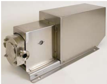
Motor- och pumpkåpa

2/018/SK90 (max. pumpkapacitet 150 lit./min.)